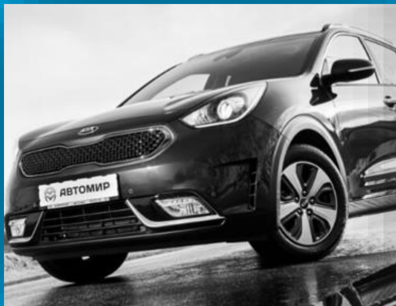
OSOBNÉ A ÚŽITKOVÉ AUTOMOBILY