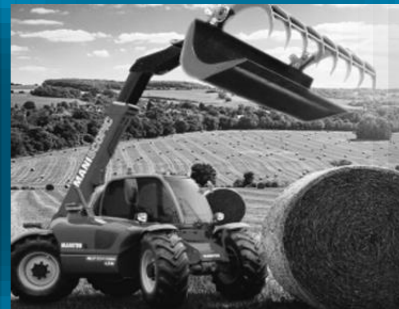
STROJE, ZARIADENIA A TECHNOLÓGIE