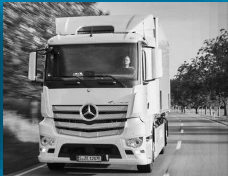
NÁKLADNÉ AUTOMOBILY A AUTOBUSY