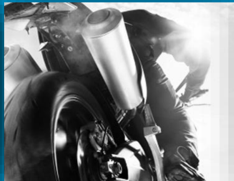
MOTOCYKLE A ŠTVORKOLKY